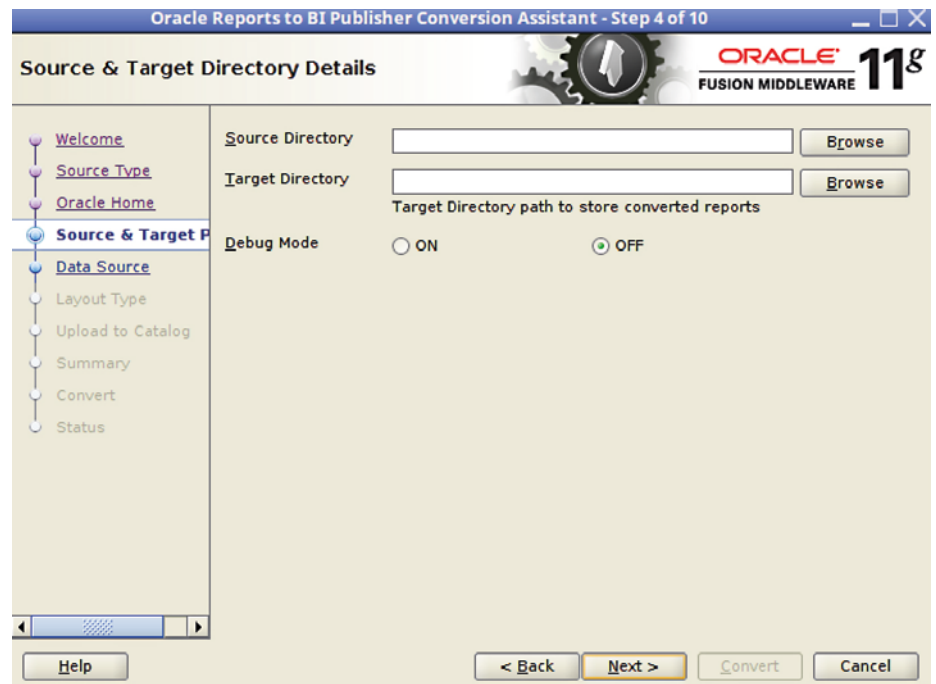
Abbildung 2: Oracle Reports to BI Publisher Conversion Assistant

Hinzu kommt ein weiterer wichtiger Punkt, der bei einer Umstellung nicht vergessen werden sollte. Einer der großen Vorzüge des Oracle BI Publisher ist die Modularität, also die Möglichkeit, ein und dieselbe Datenstruktur (Datenmodell) mit unterschiedlichen Layouts (Templates) darzustellen. So konnte es gelingen, die Zahl der Berichte in der E-Business Suite bei der Umstellung auf den BI Publisher um den Faktor zehn zu reduzieren, ohne dass die Anwender auf ihre gewohnten Berichte verzichten mussten. Bei der Umstellung sollte versucht werden, Berichte mit einem ähnlichen Datenmodell zu einem Bericht mit mehreren Templates zusammenzufassen.